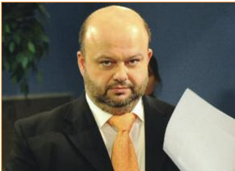
Ministr vnitra Martin Pečinka

Jestli to je, nebo není dobrá reklama, tak otázka nestojí. Podstatné je si uvědomit, jakou zprávu vysílá Nejvyšší správní soud svým rozhodnutím do celé české společnosti, pravicové extremisty nevyjímaje. A v této zprávě je naprosto jednoznačně řečeno, že česká společnost extremismus netoleruje. V boji proti němu je to důležitý krok. Nemůžeme si ale myslet, že je vše za námi. Demokratický režim musí s extremismem bojovat stále. Nikdy nebudeme na konci toho našeho úsilí a jsem přesvědčen, že právě rozhodnutí o rozpuštění Dělnické strany je velmi důležitým mezníkem na této naší cestě.